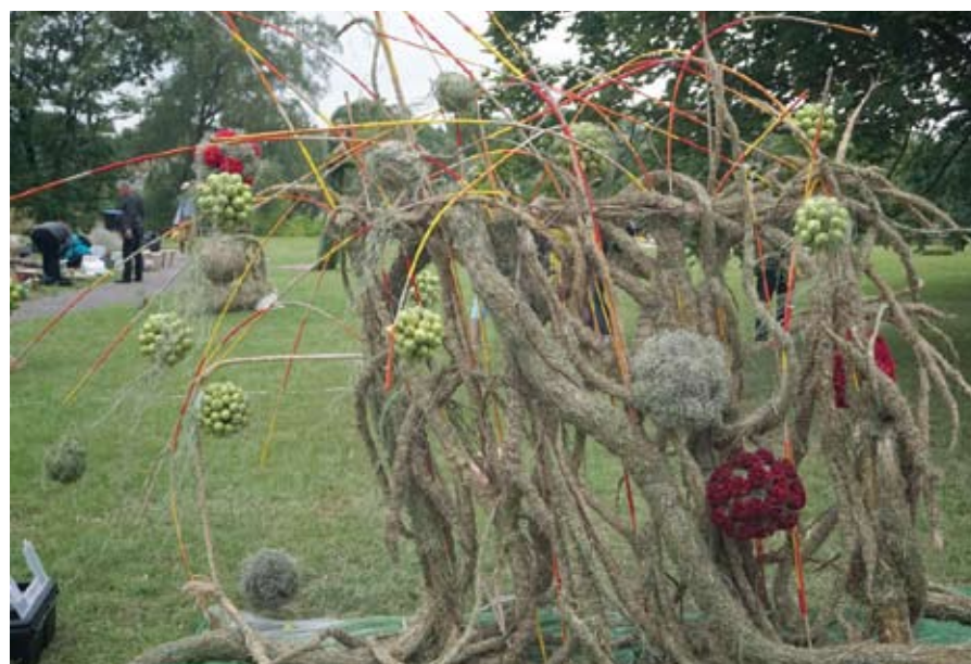
Vilniaus paslaugų verslo profesinio mokymo centras. „Anykščių rojaus obelis.“