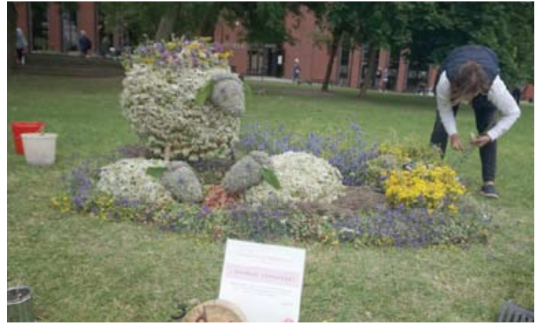
Debeikiečių bendrija. „Avinėlių žydėjimas“.

Jie jau taip išstobulėjo, kad dabar Ventspilio meistrų kilimai vargiai patektų pas mus tarp prizininkų.“