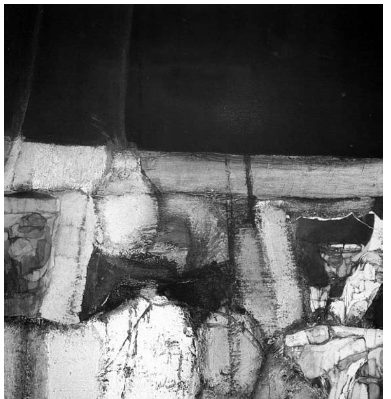
Rudolfas Baranikas. Citatos (detalė).1965