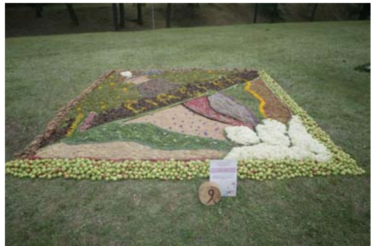
Ceikinių kaimo bendruomenė. „Čia gera“.