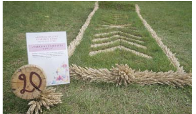
Anykščių rajono Burbiškio kaimo bendruomenė. „Takelis į vaikystės namus“.