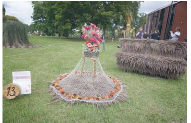
Anykščių rajono Šerių kaimo bendruomenė. „Sėsk, brangioji, ant suoloelio“.