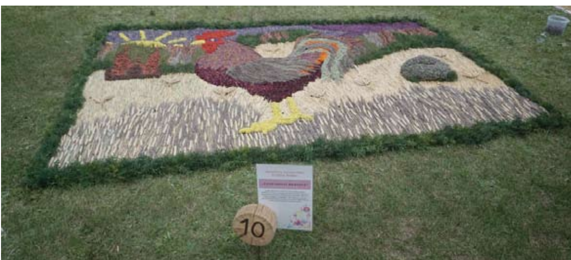
Anykščių socialinės globos namai. „Legendinis herojus“.