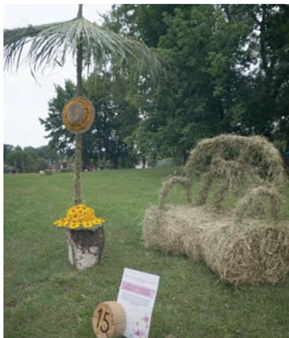
Ažužerių moterų klubas. „Čia gera svajoti: svajonių suolelis“.