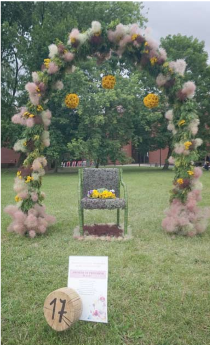
Anykščių rajono Skiemonių kaimo bendruomenė. „Prisėsk ir prisimink mane“.

Anykščių turizmo ir verslo informacijos centras šį tarptautinį konkursą Anykščiuose rengia jau keturioliktą kartą. Šiemet čia dalyvauja 21 komanda. Į konkursą atvyko komandos iš šių Lietuvos miestų: Ukmergės, Mažeikių, Anykščių, Telšių, Joniškio, Ignalinos, Vilniaus, Švenčionių. Taip pat sulaukta svečių iš užsienio, kaimyninės Latvijos Madonos regiono.