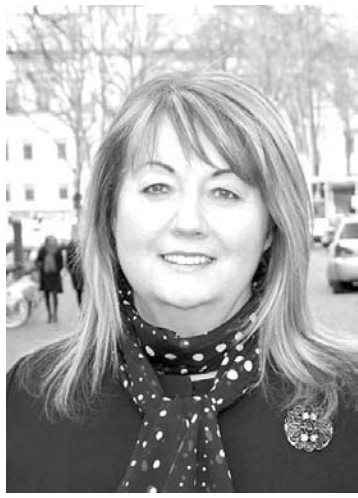
Vilija Blinkevičiūtė: „Gerai, kad ES ir dauguma valstybių pasimokė iš 2008 metų krizės klaidų“.

Taip teigia socialdemokratė Vilija BLINKEVIČIŪTĖ, Europos Parlamento Užimtumo ir socialinių reikalų komiteto vicepirmininkė. Pokalbis su ja – apie ES mastu priimtus ar ketinamus priimti sprendimus įveikiant COVID-19 pandemijos sukeltą krizę.