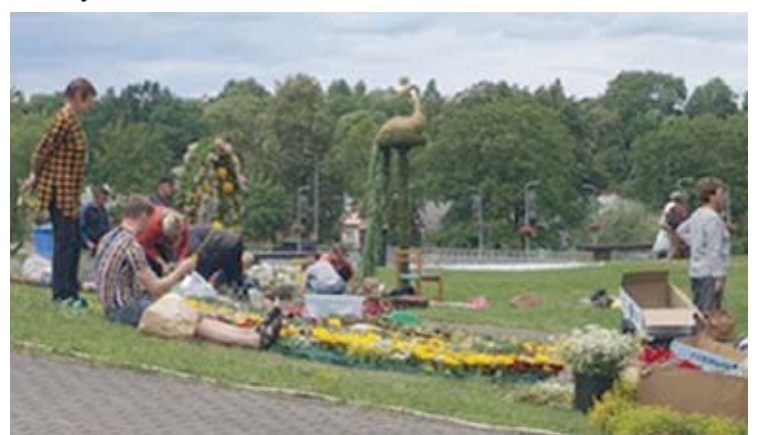
Kilimų pynimas - preciziškas darbas. Net ir vakarėjant daugelis kūrinių dar nebuvo baigti.